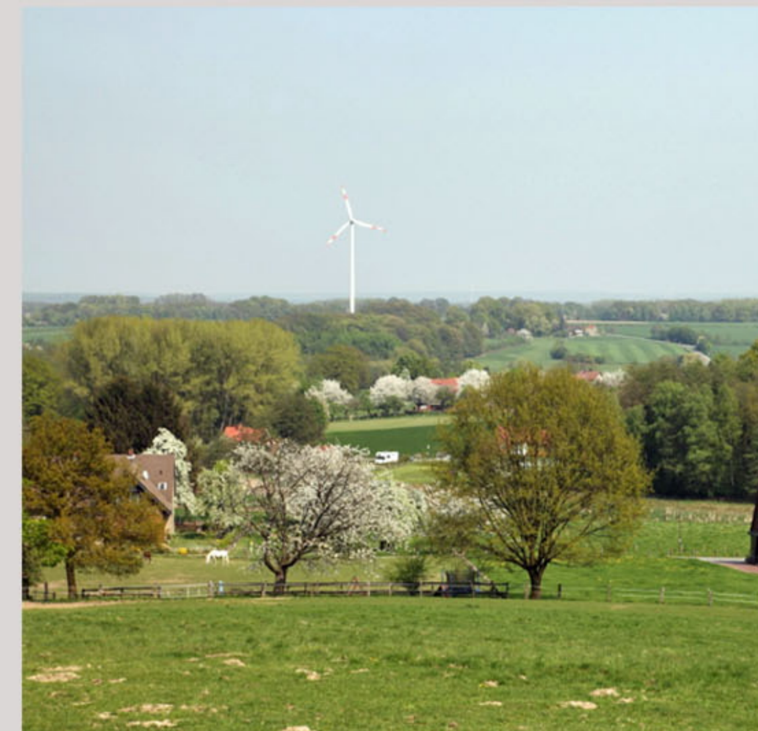
Blick vom Schafberg nach Norden